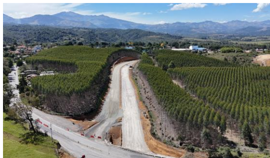
UF1- Variante Santa Rita, La Cabuyera, K 3+742, K 3+848