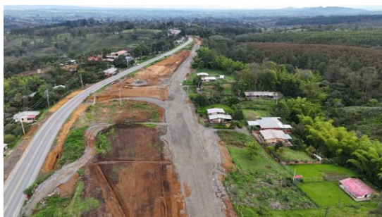
UF1- El Cairo, Cajibío K 16+500