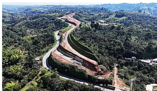
UF3- La Independencia, Piendamó K 41+900