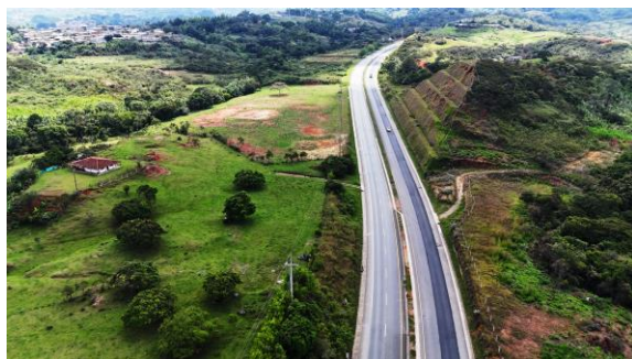
UF4 – Variante Santander de Quilichao – K 72