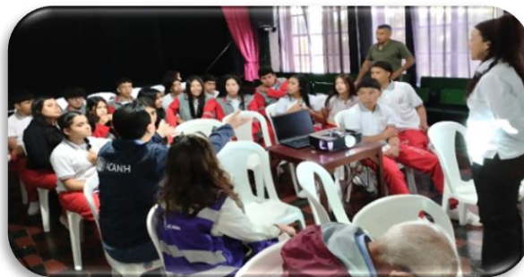
Participación del ICANH en programa de divulgación a la comunidad

Los evaluadores del ICANH han realizado a través del desarrollo del proyecto múltiples visitas técnicas de seguimiento y supervisión para garantizar el estricto desempeño del Programa de Arqueología Preventiva. Durante las visitas se recorren los diferentes frentes de obra, se supervisa el registro de los sitios arqueológicos y el control de la gestión documental.