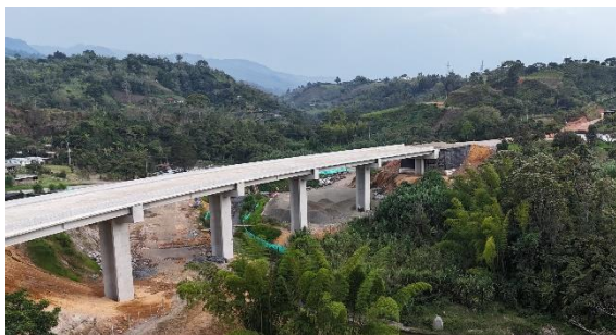
UF2 - Puente Bermejil, Piendamó - Tunía K 34+093 – K 34+249