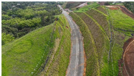
UF2- Par vial Tunía, K 26+350 - K 26+520