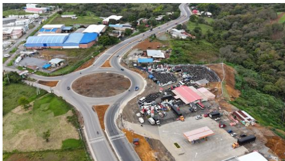
UF1- Glorieta Parque Industrial Popayán K 0+800

Nuevo Cauca S.A.S. continúa cumpliendo con la ejecución del cronograma de obra, a la fecha se cuenta con 39 frentes de obra activos.