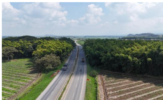
UF4 – Variante Santander de Quilichao – K 76