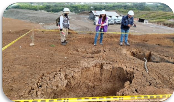
Visita del ICANH a sitios funerarios del proyecto

Se realiza acompañamiento y participación en los procesos de inducción al personal que ingresa al proyecto, capacitación al personal de apoyo del equipo de arqueología y de los diferentes actores del proyecto y divulgación del avance del programa a la comunidad e instituciones tanto gubernamentales como educativas.