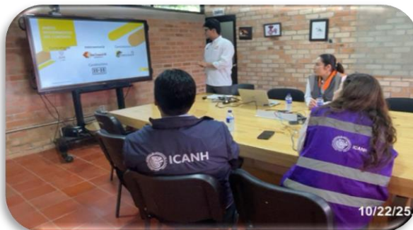
Presentación del proyecto a la subdirección y evaluador del ICANH

Los evaluadores del ICANH han realizado a través del desarrollo del proyecto múltiples visitas técnicas de seguimiento y supervisión para garantizar el estricto desempeño del Programa de Arqueología Preventiva. Durante las visitas se recorren los diferentes frentes de obra, se supervisa el registro de los sitios arqueológicos y el control de la gestión documental.