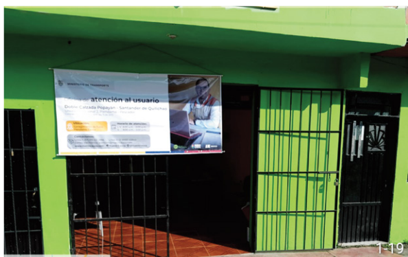
Corregimiento de Tunía – UF2 Municipio de Piendamó, Pr 27+650 Contacto: 310 221 2866