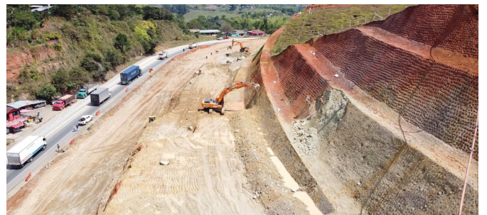
UF3- Construcción segunda calzada El Rosal, Caldono K 51+200