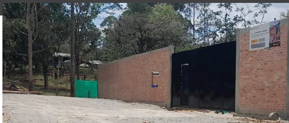
Vereda El Cairo – UF1 Municipio Cajibío, Pr 15+850 Contacto: 310 221 2971

También se cuenta con canales virtuales y telefónicos para resolver las peticiones, quejas reclamos, sugerencias y temas relacionados con las obras de construcción.