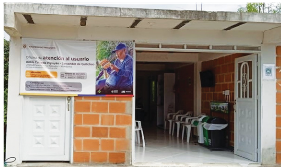
Corregimiento de Mondomo – UF3 Municipio Santander de Quilichao, Pr 56+100 Contacto: 310 704 1770