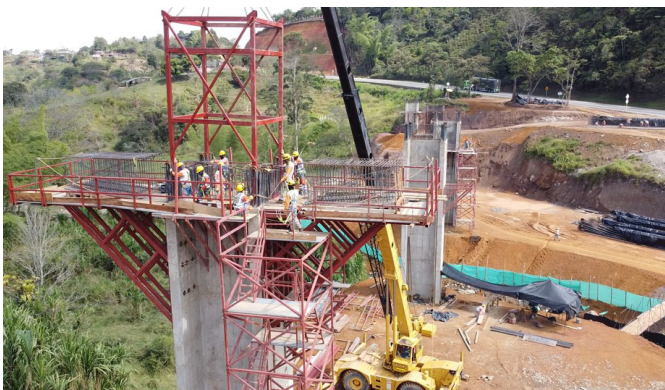
UF2- Construcción puente Bermejil, Piendamó, K 34