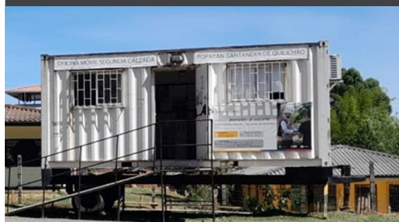
Oficina Móvil 1: 323 442 6347 Oficina Móvil 2: 310 221 2881