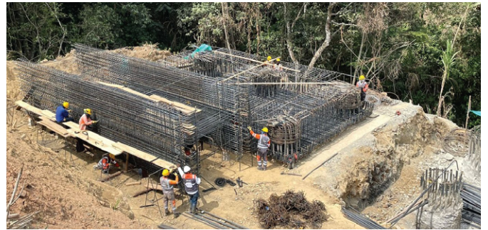
UF4- Construcción Puente Cascadas, La Agustina, Santander de Quilichao K 57+800