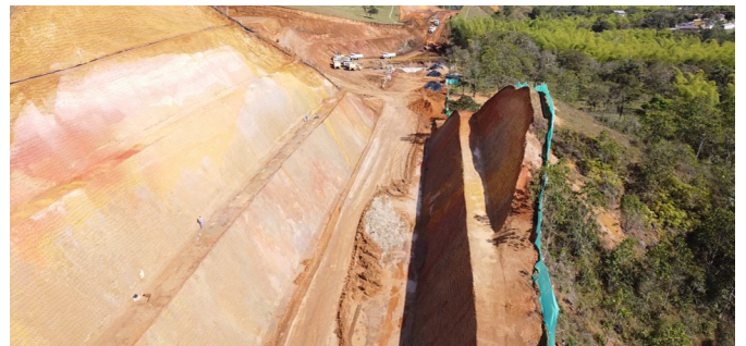
UF2- Construcción Par vial Tunía, K26+800