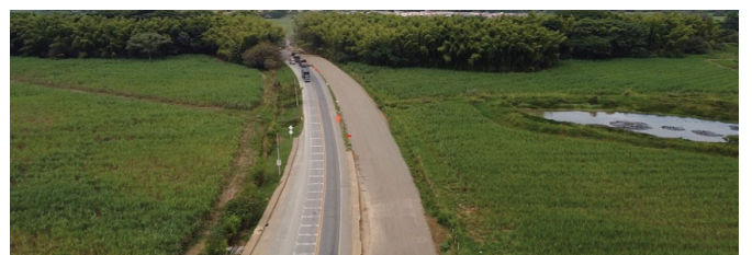
UF4- Construcción segunda calzada variante, Santander de Quilichao K 76