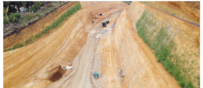
UF1- Construcción segunda calzada Florencia, Totoró, K 7