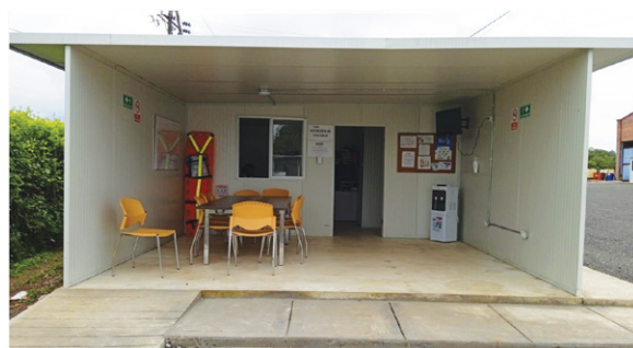
Parque industrial - El Paraíso, manzana E lote 3A Municipio Santander de Quilichao Contacto: 323 442 6341