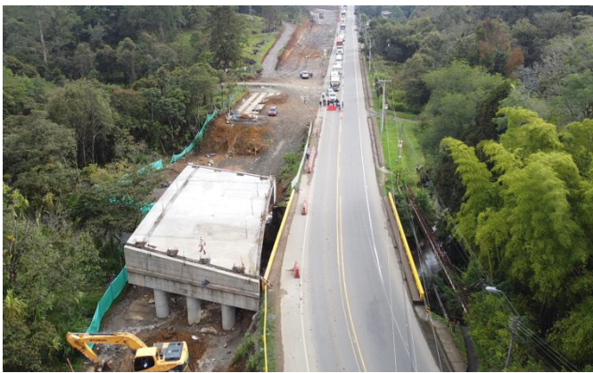
UF1- Puente Rio Blanco, K 1+450

La concesionaria continúa con los pare y siga solo para entrada y salida de volquetas de lunes a sábado de 6 a.m. hasta las 6:00 p.m. Y domingos de 6:00 a.m. a 12 del mediodía. A continuación, presentamos algunos avances de obra: