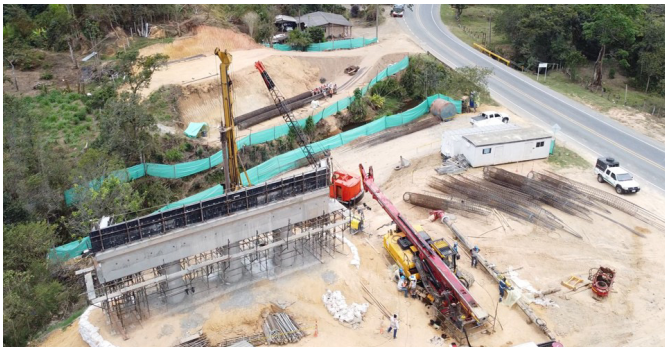
UF1- Construcción Puente Cajibío, K 17+230