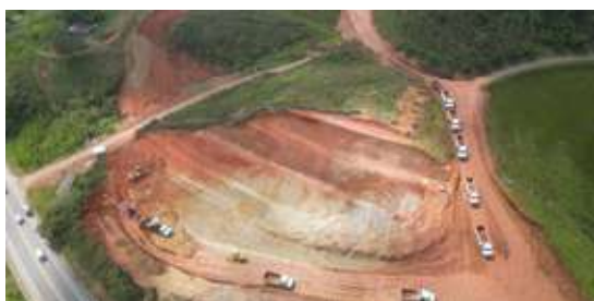
Segunda calzada vereda El Rosal, Caldoño