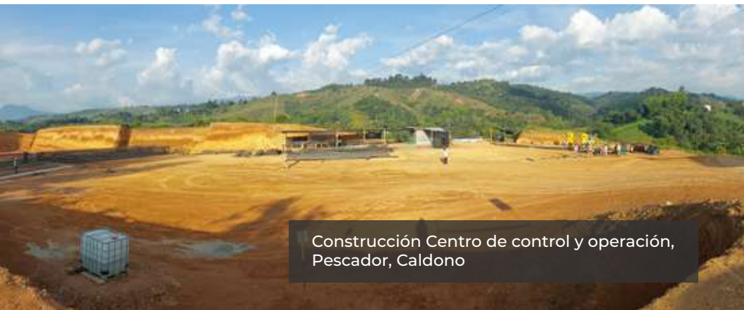
Construcción Centro de control y operación, Pescador, Caldoño