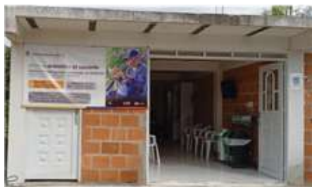
Corregimiento de Mondomo – UF3 Municipio Santander de Quilichao, Pr 56+100 Contacto: 310 704 1770