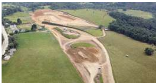
Retorno vereda La Cabuyera, Popayán