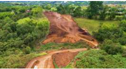
Construcción variante Piendamó