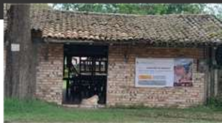
Vereda La Cabuyera - UF1 Municipio de Popayán, Pr 4+570 Contacto: 310 221 2971

También se cuenta con canales virtuales y telefónicos para resolver las peticiones, quejas reclamos, sugerencias y temas relacionados con las obras de construcción.