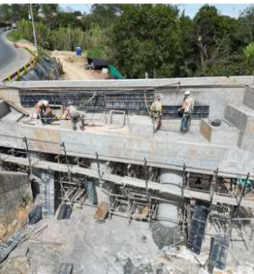
Construcción puente Río Blanco, Popayán