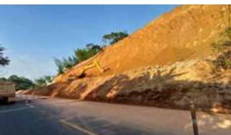
Segunda calzada vereda El Descanso, Caldoño