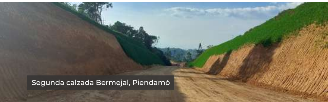
Segunda calzada Bermejál, Piendamó