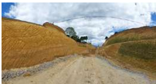
Segunda calzada corregimiento Florencia, Totoró