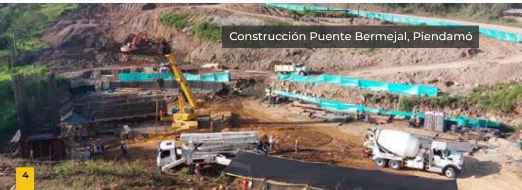
Construcción Puente Bermejál, Piendamó