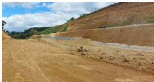
Segunda calzada Real Palacé, Popayán