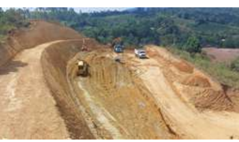
Corte de talud, El Cairo Cajibío