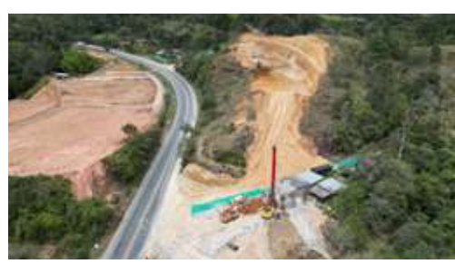
Construcción Puente Quebrada Cajibío