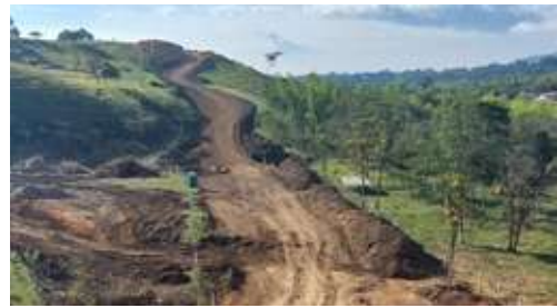
Construcción Par vial de Tunía, Piendamó