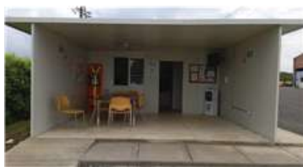
Parque industrial - El Paraíso, manzana E lote 3A Municipio Santander de Quilichao Contacto: 323 442 6341