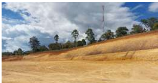
Zona de pesaje, El Cairo, Cajibío