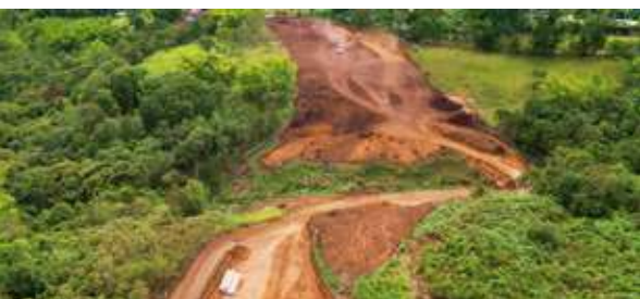
Segunda calzada vereda La Agustina Santander de Quilichao