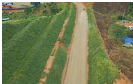
Par vial Quinamayo