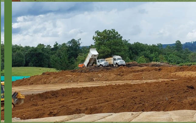
ZONA DE DISPOSICIÓN DE MATERIAL ESTÉRIL.