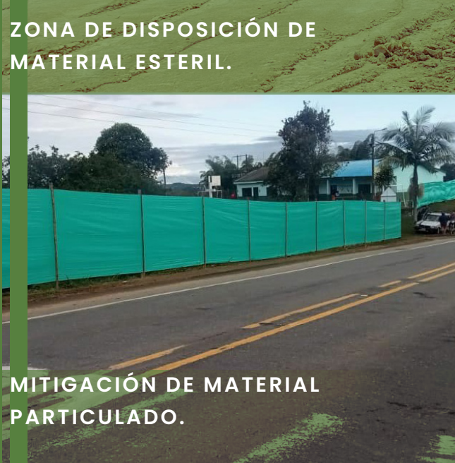
MITIGACIÓN DE MATERIAL PARTICULADO.