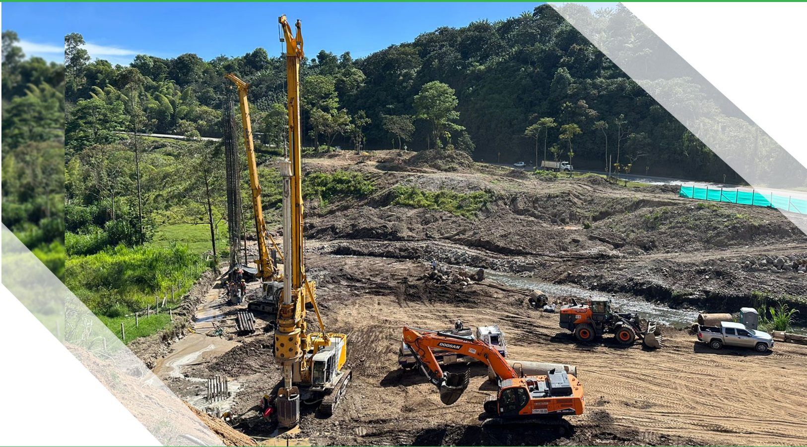
"Construcción puente Bermejál, Piendamó"

kilómetro 18 a 20 minutos de Popayán vía panamericana a Santander de Quilichao Ven y conoce este mágico lugar. Reservas. 310 514 9111